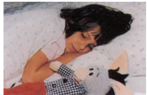
A kellemes meleg növeli a biztonságérzetet

10. Az olyan fűtés, amely komfortos és egyszerűen kezelhető.