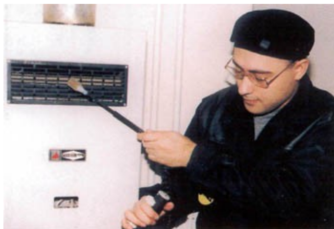
A kéményseprő műszerrel ellenőrzi az égéstermék maradéktalan eltávozását

A kéményseprő kötelessége, hogy négy évente az épület teljes kéményállományát műszaki szempontból, az építésrendészeti és tűzvédelmi előírások figyelembevételével, teljes körű vizsgálatnak vesse alá. Ekkor a kémények tömörségi vizsgálatát is el kell végeznie. A műszaki felülvizsgálat keretei között teljes körű diagnózist állít fel, mely Önt segíti az előrelátó tervezésben, a felújítási, tatarozási állagmegóvó karbantartási munkálatok vonatkozásában.