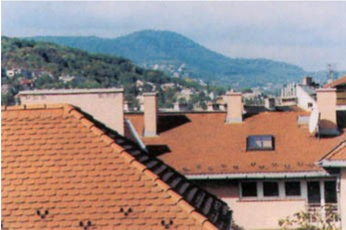
A régi kémények bár szép látványt nyújtanak, műszakilag optimálisnak egyáltalán nem nevezhetők

Az Ön kéményválasztását több tényező is befolyásolja.