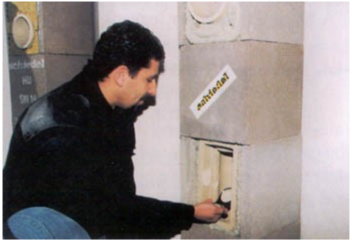
A korszerű fűtéshez nélkülözhetetlen a tömör és nedvességnek ellenálló (nedvességre érzéketlen) kémény

4. A kémények és égéstermék-elvezetők időszakos tisztítása