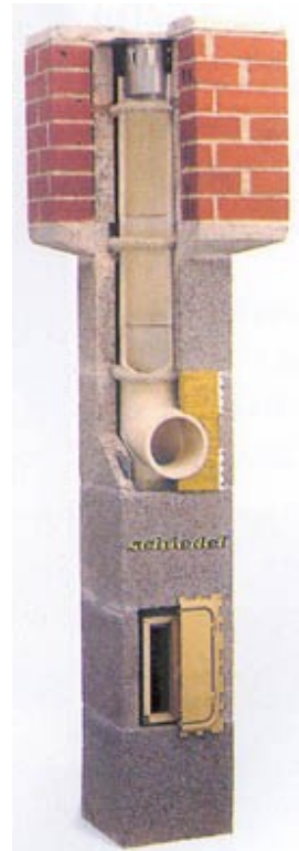
Minden tüzelőanyagra alkalmas, korszerű kémények

Három kéménnyel megőrzi a teljes cselekvési szabadságát! Ajánlatos központi fűtéses vagy távhővel fűtött lakóépületnél is minden lakás esetében e megfontolás alapján tervezni! Ezzel minden ott lakó családnak - legyen akár bérlakása, akár saját tulajdonú lakása - lehetősége nyílik egy "előre nem várt helyzet" esetén, független saját fűtés alkalmazására is.