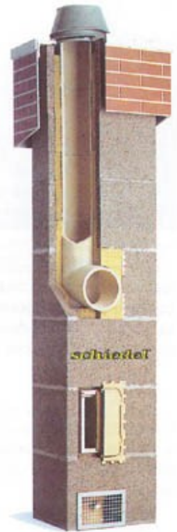
A felsorolt követelményeknek megfelelő korszerű kémények

Ő tudni fogja, hogy miképpen kell a károsodott kéményt felújítani, illetve az újonnan választott kazánjához megfelelően illeszteni, a biztonság teljeskörű figyelembevételével.