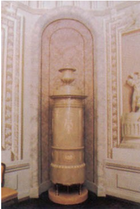
A cserépkályha hőjét elsősorban sugárzással adja le és ezzel jelentősen hozzájárul a helyiség kellemes klímájához