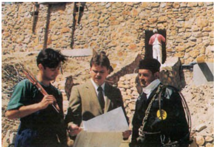
Az Ön kéményseprője kezdettől fogva jó tanácsadója lesz minden - kémény és fűtéssel kapcsolatos - problémájának megoldásában